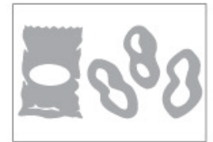
Real Dial Size ON (Activé)

Find instructions in Spanish and German at provocraft.com Instrucciones en español et en allemand chez provocraft.com Instrucciones en español y en alemán en provocraft.com Anleitung auf Deutsch und Spanish unter provocraft.com