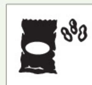
Real Dial Size OFF