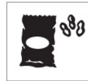
Real Dial Size OFF (Désactivé)