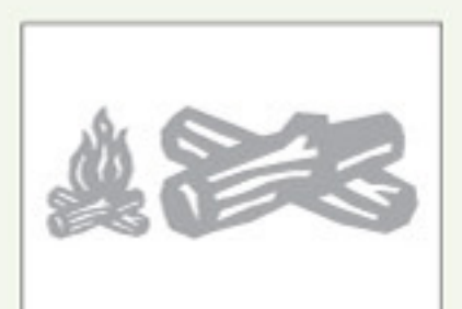
Real Dial Size ON

Find instructions in Spanish and German at provocraft.com Instrucciones en español et en allemand chez provocraft.com Instrucciones en español y en alemán en provocraft.com Anleitung auf Deutsch und Spanisch unter provocraft.com