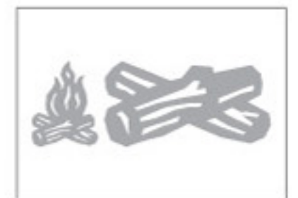
Real Dial Size ON (Activé)

Find instructions in Spanish and German at provocraft.com Instrucciones en español et en allemand chez provocraft.com Instrucciones en español y en alemán en provocraft.com Anleitung auf Deutsch und Spanisch unter provocraft.com