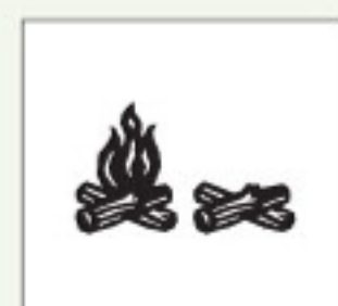
Real Dial Size OFF