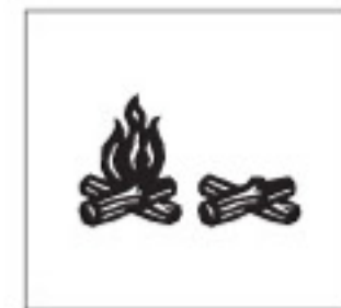
Real Dial Size OFF (Désactivé)