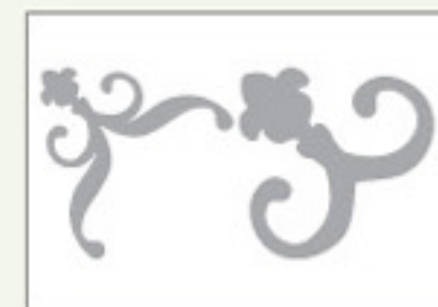
Real Dial Size ON

Find Instructions in Spanish and German at provocraft.com Instrucciones en español et en allemand chez provocraft.com Instrucciones en español y en alemán en provocraft.com Anleitung auf Deutsch und Spanish unter provocraft.com