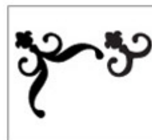
Real Dial Size OFF (Désactivé)