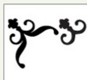
Real Dial Size OFF