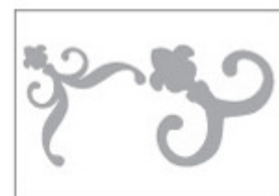
Real Dial Size ON (Activé)

Find Instructions in Spanish and German at provocraft.com Instrucciones en español et en allemand chez provocraft.com Instrucciones en español y en alemán en provocraft.com Anleitung auf Deutsch und Spanish unter provocraft.com