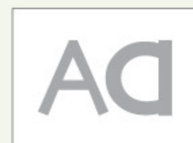
Real Dial Size ON

Find instructions in Spanish and German at provocraft.com Instructions en espagnol et en allemand chez provocraft.com Instrucciones en español y en alemán en provocraft.com Anleitung auf Deutsch und Spanisch unter provocraft.com