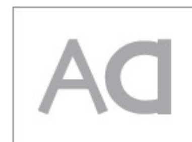
Real Dial Size ON (Activé)

Find instructions in Spanish and German at provocraft.com Instructions en espagnol et en allemand chez provocraft.com Instrucciones en español y en alemán en provocraft.com Anleitung auf Deutsch und Spanisch unter provocraft.com