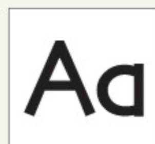
Real Dial Size OFF