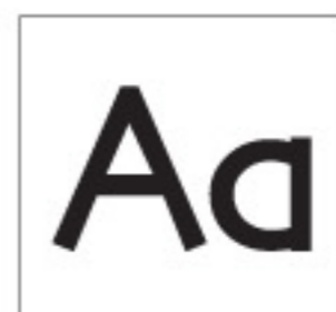
Real Dial Size OFF (Désactivé)